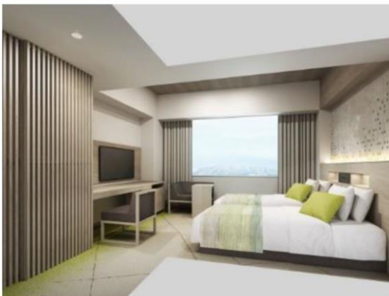
客室デザイン（ハリウッドツインタイプ）