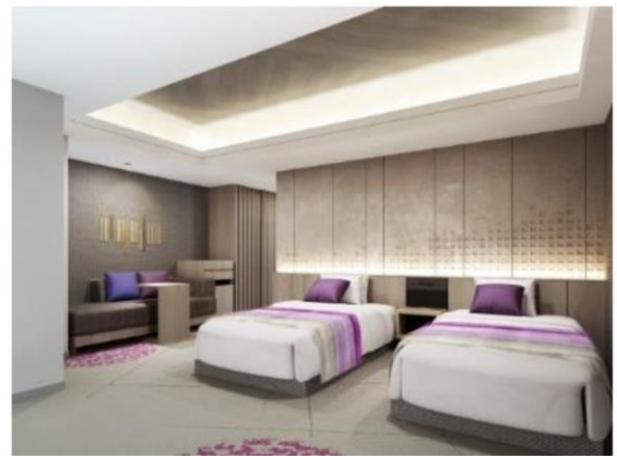
客室デザイン（ツインタイプ）